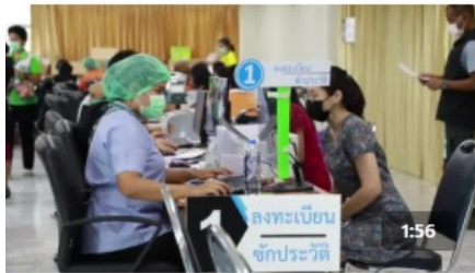
คุณ และ คนอื่นอีก 64 คน การรับชม 1.6 พัน ครั้ง · 28 สัปดาห์ที่แล้ว